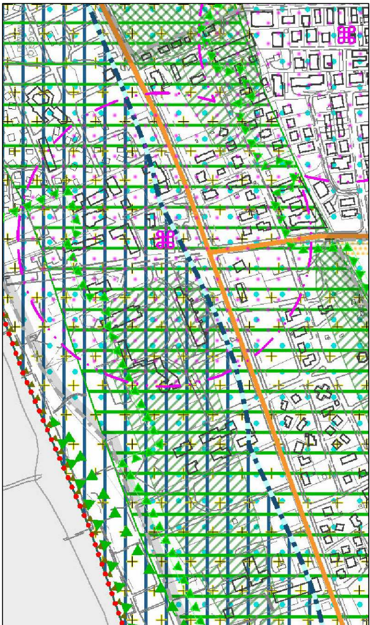
ESTRATTO DEL PAT

RICHIESTA AUTORIZZAZIONE PAESAGGISTICA PERMESSO DI COSTRUIRE IN DEROGA AI SENSI DEL d.p.r. 380/01 Art.14 PER CAMBIO DI DESTINAZIONE D'USO DA COMMERCIALE A RESIDENZIALE DI UNA PORZIONE DI EDIFICIO ESISTENTE SITO A JESOLO (VE) VIALE ORIENTE 84